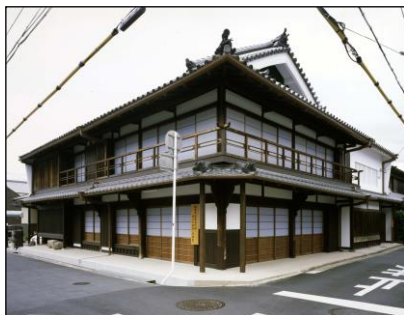
八木札の辻交流館 外観